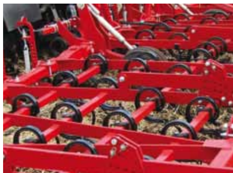
Идеальная подготовка почвы

Расположенные в четыре ряда S-образные пружинные стойки с установленными на них различными рабочими органами обеспечивают наилучшее перемешивание обрабатываемого слоя почвы с последовательным крошением её до оптимальных агротехнических размеров;