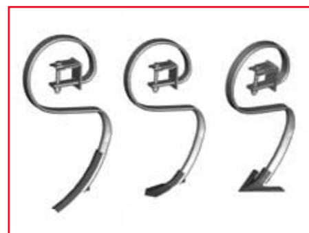
Адаптация к различным видам почв

На легких почвах планка устанавливается с наклоном вперед, в сторону трактора. Таким образом, на ровных полях культиватор испытывает меньшее сопротивление почвы.