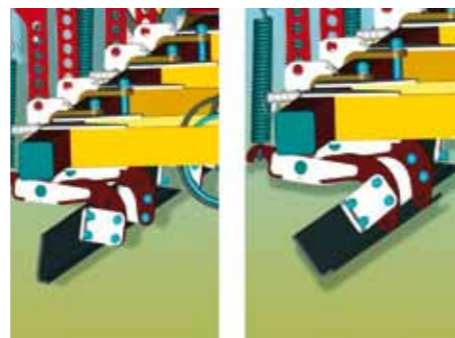
Идеально ровная поверхность почвы

Для дополнительной обработки уплотненной почвы от колес трактора, ЧЕРВОНЕЦ оснащен следорыхлителями, которые регулируются по высоте и ширине колеи.