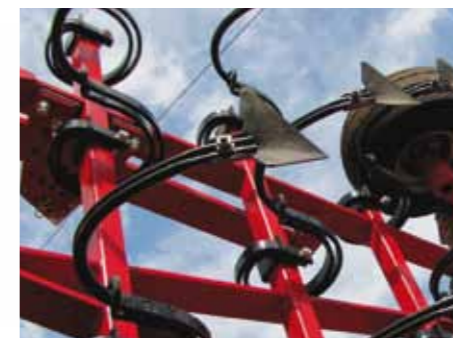
Эффективная обработка тяжелых почв

Для тяжелых, труднообрабатываемых почв на 3-D стойку ЧЕРВОНЦА дополнительно устанавливается подпружинник.