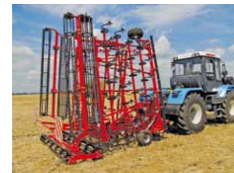
Легкий перевод в транспортное положение и обратно

Для тяжелых, труднообрабатываемых почв на 3-D стойку ЧЕРВОНЦА дополнительно устанавливается подпружинник.