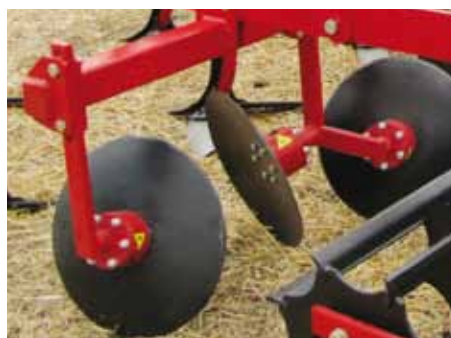
Простота регулировки глубины обработки

Съемные опорные колеса, регулируемые по высоте винтом, позволяют выдерживать заданную глубину, даже на тракторах без позиционного регулирования положения навесной системы.