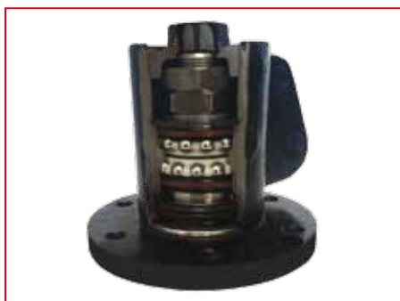
Уникальный подшипниковый узел

В моделях ШИЛЛИНГ -2 и ШИЛЛИНГ -4 каток не сдвоенный.