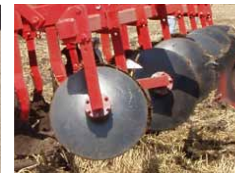
Рабочие органы премиум класса

Широкие крыльчатые лемехи установлены под особым углом вниз, благодаря чему достигается подрезание пласта почвы по всей поверхности и оптимальное перемешивание даже на небольшой глубине. Рабочая ширина острия длинных боковых поверхностей лемехов сохраняется на протяжении всего срока эксплуатации.