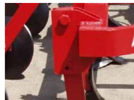
Возможности регулировки для разных видов почв

Путем простой перестановки оси ограничителя глубины и перемещения вперед блока вогнутых дисков с катком достигается оптимальное расположение центра тяжести для осуществления транспортировки агрегата, что существенно снижает нагрузку на навесную систему трактора.