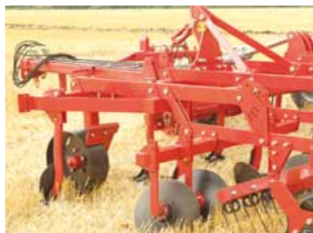
Универсальная конструкция рамы

Подшипниковый узел катка не требует обслуживания в течение всего срока службы, благодаря высококачественным кассетным уплотнениям и закрытым подшипникам HARP-AGRO.