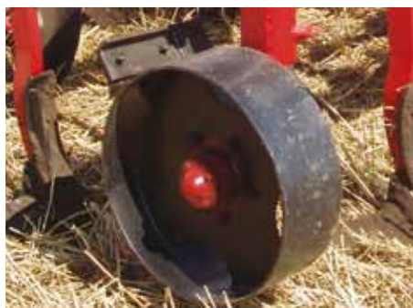
Стабильная глубина обработки

Съемные опорные колеса, регулируемые по высоте винтом, позволяют выдерживать заданную глубину, даже на тракторах без позиционного регулирования положения навесной системы.