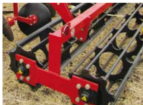
Высокоэффективный сдвоенный каток

Специальная конструкция гарантирует интенсивное крошение почвы и ее оптимальное обратное уплотнение. Передний ножевой каток специально заточен и закален для более качественного разрезания пожнивных остатков. Отсутствие центральной оси предотвращает забивание катка.