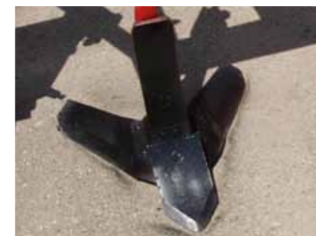
Оптимальное рыхление и дренаж слоев почвы

Посредством перестановки срезного болта можно регулировать угол наклона лап и обеспечивать отличное вхождение даже в сухую твердую почву.