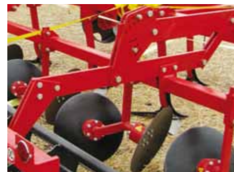
Оптимальное расположение центра тяжести

Расположенные за культиваторными лапами выравнивающие диски, установленные на параллелограмме катка, не требуют дополнительного регулирования при установке глубины.